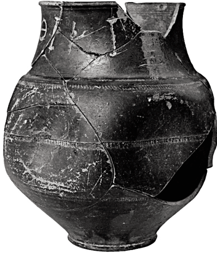
Fig. c. Echelle 1:2