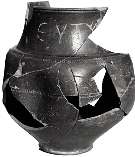
Fig. b. Echelle 1:2