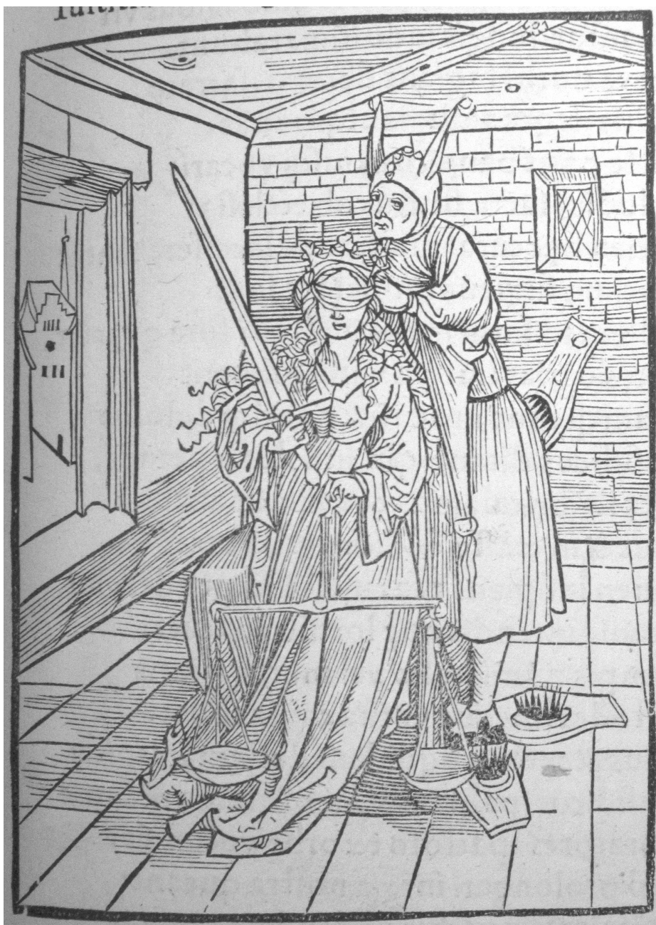
Sebastian Brant, Stultifera navis , Basel, Johann Bergmann (de Olpe), [1 er VIII] 1497, 4 o (GW 5061). Allégorie de la justice aux yeux bandés.